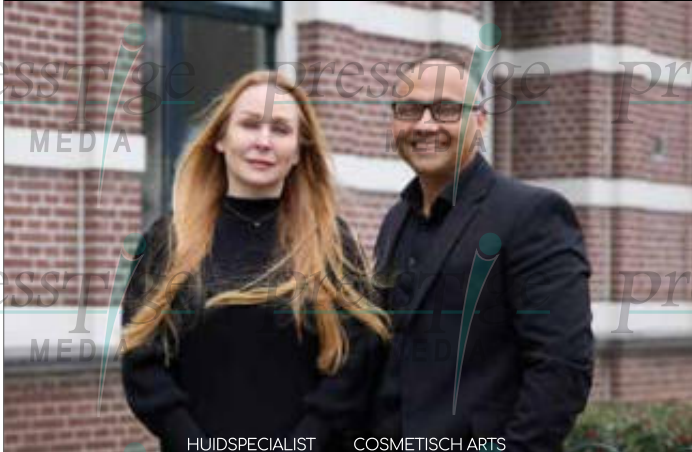
HUIDSPECIALIST COSMETISCH ARTS